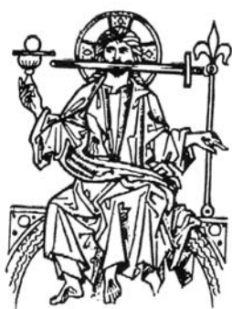
"Mida sa näed, kirjuta raamatusse...", 1260.