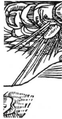
Vanaisa räägib oma lastega kõuehäälel, 1492.

Jumal ilmutavat end nii hääles, sõnas kui täielikus vaikus. Kui kutsutakse üles minema vaikus kuulama, tähendab see kutses kuulata jumalat.