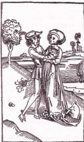
Kurat läheneb naisele – varju heitmata, jälgi jätmata, 1490.