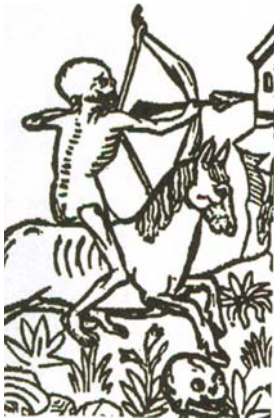
Surmavarju maal, 1461.