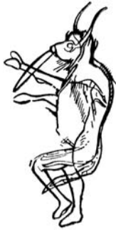
Teisipoosuse varjupildid koopaseinal, 12 000 eKr.