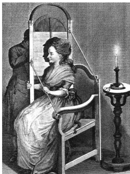
Varjulõiketehnika, 18. sajandi lõpp.

Vari näib kuidagimoodi tasakaalustavat valguse ja kaose igavest vastasseisu, meenutades ühtlasi, et ega varjuraala oleks õieti valgustki. Elu saab alguse surmast, valgus varjust, päev ööst. Seda seisukohta, et päev algab keskööga, jagasid mitmed vanad rahvad, nii vanad roomlased kui meiegi esivanemad (vrd ööpäev). Keldid arvestasid aega ööde, mitte päevade kaupa.