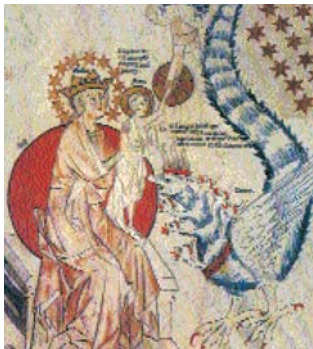
Kukekujuline apokalüptiline draakon, Saksamaa, ca 1350.