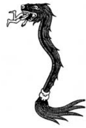
Inime kaob mao kurku, Mehhiko.

Võimalik, et nii seda kui teist – näiteks udmurdi uskumuste kohaselt tuleb päikesekera kuuvarjutus sellest, et õhus lendav tulemadu ahmib tulise taevakeha suhu ja kui see teda põletama hakkab, sülgab uuesti välja (Lintrop).