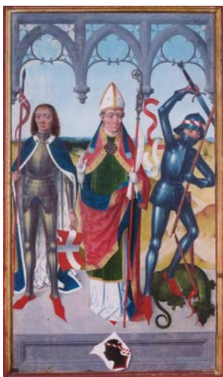
Püha Jüri, draakonitapja, võitleb Tallinna vapivärvides. Niguliste kiriku peaaljar (detail), Hermen Rode, 1478–1481.