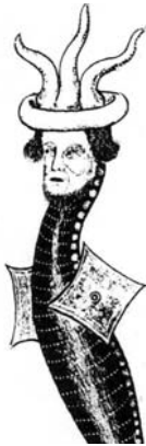
Narrimütsis draakon, ca 1330.