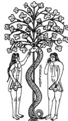
Pattulangemine, madu põhitegija.