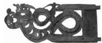
Tuulelipp Tallinnas, praegune asukoht Kohtu t 6.