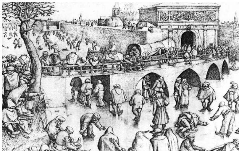
Antwerpen, Püha Jüri värv. Pieter Bruegel, 1558.