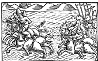
Moskvalane ründab jääd mööda, 1495.