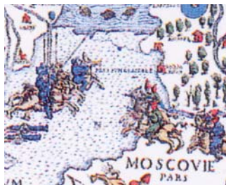
Olaus Magnus, Carta Marina (detailid), 1539.