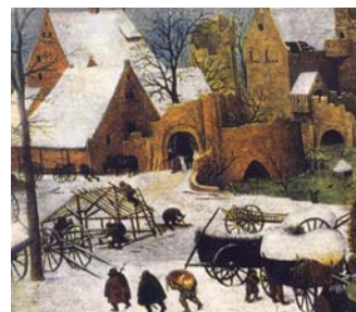
Talv on tulnud kuidagi äkki ja ootamatult. 1565, 1566.