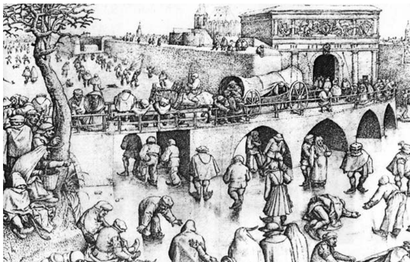
Antwerpen, Püha Jüri värav. Pieter Bruegel, 1558.