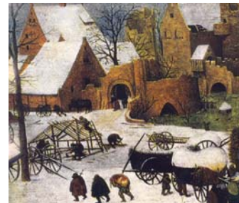
Talv on tulnud kuidagi äkki ja ootamatult. 1565, 1566.