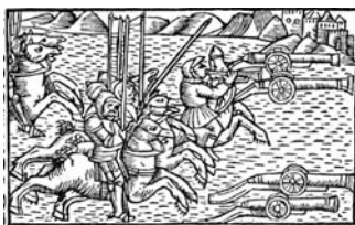
Jäälahing Olaus Magnuse järgi.