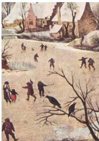
Talvine maastik. Pieter Bruegel, 1565.