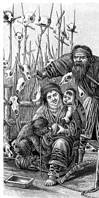
Karu poeg ainu naise põlve peal.