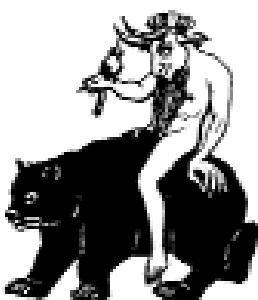
Kurat ratsutab musta karu seljas.