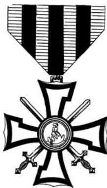
Läti Karutapja ordeni rist, 1919.