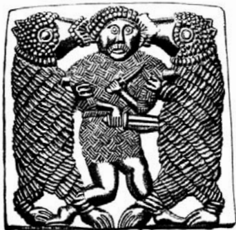
Karutapja. Kiivri ehisplaadike, Öland, 6. sajand.