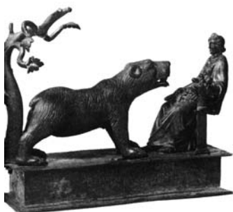
Keldi karu jumalanna Artio palge ees.