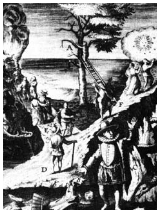
Kaks teed – õigete tee ja patuste tee.