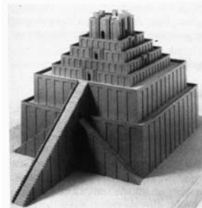
Paabeli torn kui taevatrepp (rekonstruktsioon).