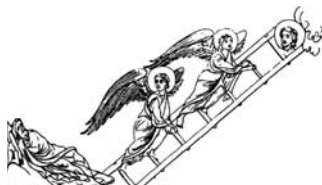
Jaakobuse unenäoline taevareedel, 12. sajand.