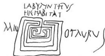
Labürint, tee tõeni.