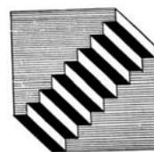
Kuhu see trepp õieti viib – üles või alla?