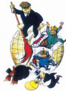
Тов. Ленин ОЧИЩАЕТ ЗЕМЛЮ ОТ НЕЧИСТИ.

Luuamotiiv levis ka läinud sajandil Venes. Leninitki kujutati luuamehena, kes raudse luuaga pühib eest kapitalistlikud jätsed. Meie isamaaliku loosungi "Plats puhtaks!" algne mõte olnud hoida eelkõige oma õu puhas. Tulemusi arvestades oleks sellega võinud ausalt öeldes piirdudagi.