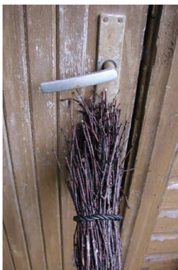
Luuakonts ukse ees.