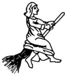
Nõid sõidab luua seljas, 1451.