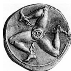
Sitsiilia triskelemündid, 4.–3. sajand eKr.