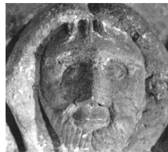
Nn peajalad Karja kirikust.