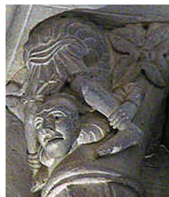
Romaani peajalad Prantsusmaalt (Aulnay, Tournus).