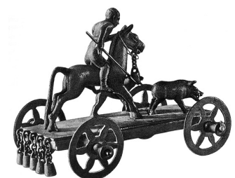
Keldi seajaht, Hispaania.