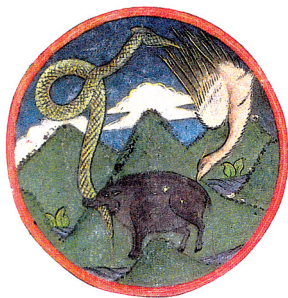
Budistlik triskelevariante eelmise sajandi algusest.