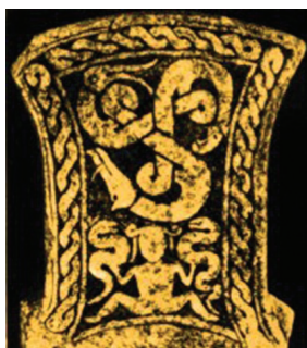
Sigatriskele: sea-, kotka- ja ussipäine triskelemadu. Gotland, 400–600 pKr.