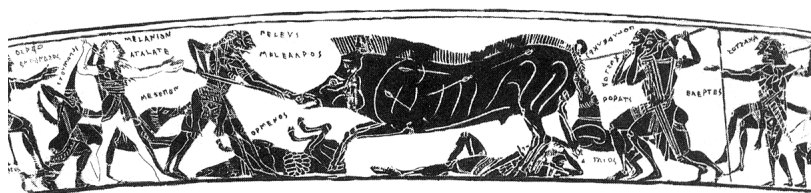
Kalydoni kuldijaht, ca 570 eKr.