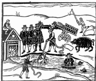
Nõia veeproov, 1613. Kuradi aktiivset osalust tähistab must emis.