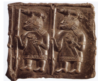
Kuldid põhjala sõjamehe kiivri peal, 7. sajand.