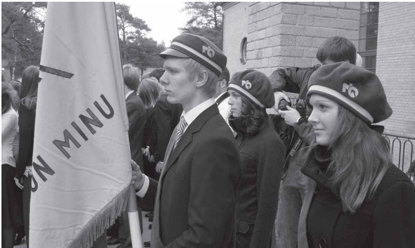
Abiturientide hinnangul tehakse kõrgkoolis edasiõppimise valik osaliselt ära juba gümnaasiumi valikuga. Pildil hetk maineka Nõmme gümnaasiumi renoveeritud hoone avamiselt 1. septembril 2008. a.

ala või õppeasutuse valiku mõjutajana. Kui üle poole (52%) RE tudengitest nimetas eriala või kooli valiku mõjutajana eelkõige tasuta õppimise võimalust, siis sama tegur oli eelkõige oluline vaid 5%-le REV üliõpilastest. Oma õpinguplaane arutavate gümnaasiuminoorte puhul tuli välja, et õpilased tähtsustavad eri tegureid. Teatud osa noorte puhul on tasuta õppekoht eeskätt oluline.