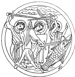
Behemoth ja Leviathan, piiblikoletised.

Kala esineb ka päikesejumaluse allilmliku liiklusvahendina: vanadel aegadel võidi uskuda niisugust (meie arvates) jaburat asja, et päike kulgeb päeva ajal taevalage pidi päikesehobuse seljas ja läbib öösel allilma ohtlikud veed kala turjal või kõhus.