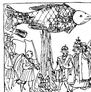
Veeuputus, mis arvati kaasnevat 1524. aasta konjunktsiooniga.