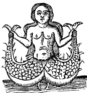
Merineitsi. Hispaania, 1520.

Ka surmatud Lemminkäinen, Kaleva poeg, muutub kalaks Toone jõkke resp. saab kalade roaks. Kala neelab päikese? Lemminkäinen ärkab teatud tingimuste täitmisel uuele elule. Kui Eesti Lemming läheb kala püüdma, suundub ta võimalik et tuld tooma. Mis võib kalal ja tulel ühist olla? Soomeugrilased ja indiaanlased usuvad nimelt, et tuli asub lõhekala sisemuses. Soome müütilistes rahvalauludes neelab lõhe taevast maha sadanud päikesetulekera. Lemminge vanemate elutuli näikse peituvat kala kõhus. Soome Lemminkäinen püüab taevase tule neelanud lõhe nimetu Saare kandist, Alue järvest, tulisest kosel. Alue resp. Kaleva järvel asuv Päevapoeg lõikab