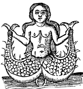
Merineitsi. Hispaania, 1520.

Ka surmatud Lemminkäinen, Kaleva poeg, muutub kalaks Toone jõkke resp. saab kalade roaks. Kala neelab päikese? Lemminkäinen ärkab teatud tingimuste täitmisel uuele elule. Kui Eesti Lemming läheb kala püüdma, suundub ta võimalik et tuld tooma. Mis võib kalal ja tulel ühist olla? Soomeugrilased ja indiaanlased usuvad nimelt, et tuli asub lõhekala sisemuses. Soome müütilistes rahvalauludes neelab lõhe taevast maha sadanud päikesetulekera. Lemminge vanemate elutuli näikse peituvat kala kõhus. Soome Lemminkäinen püüab taevase tule neelanud lõhe nimetu Saare kandist, Alue järvest, tulisest kosel. Alue resp. Kaleva järvel asuv Päevapoeg lõikab