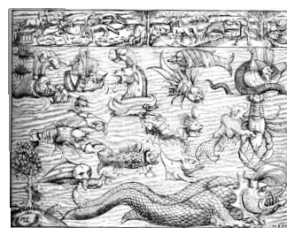
Merekoletised. Sebastian Münster, 1550.