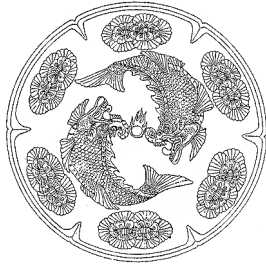
Draakonkalad mängivad meteoriidimunaga (Hiina).

Hiiumaal Kalana kabelis asus varem ühesilmaline hõberäim, kes tagas hea kalaõnne: kuhu poole nina pööranud, sääl olnud hää kalasaak.