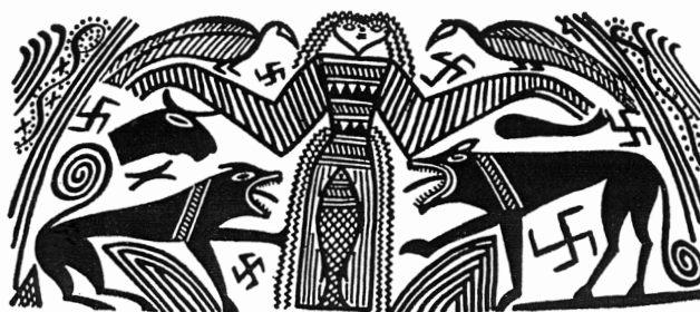
Kalast käima peale? Artemis, loomade jumalanna, ca 700 eKr.