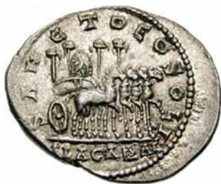
Sanct Deo Soli Elagabal.