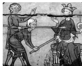
Püha Olavi põlvehaav, 1030. (Ca 1300, Norra.)