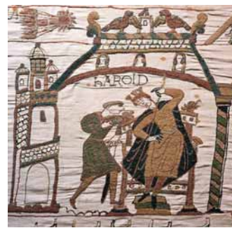
Halley komeet 1066 (Bayeux' vaip).

Taani kuninga Saaremaa külaskäigu aastal ilmutas Halley komeet end sep- tembri keskpaiku. Kui kuningas tuli Saare- maale, pidi ta seda tegema kevadel või suvel. Pole võimatu ette kujutada, et just sügisene sabatäht sundis teda jätma oma püha ürituse pooleli, lõpetama kohaloleku Saaremaal, loobuma kivilinnuse ehituse lõ- puleviimisest kaaslasid saatuse hooleks jät- tes. Halley komeedi eelmine külaskäik aas- tal 1145 oli ennustanud õnnetust: selle aas- ta lõpus välja kuulutatud teine ristisõda võit- luseks Püha Haua ja Püha Maa eest lõp- pes täieliku läbikukkumisega, julgustades moslemeid Jeruusalemma tagasi võtma.