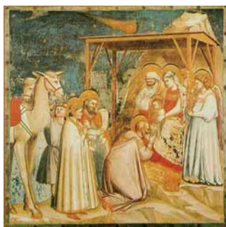
Petlemma täht. Giotto di Bondone, 1301–1305.