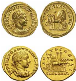
Meteoriidikivi tuuakse Väike-Aasiast pidulikult Rooma, aasta 218.