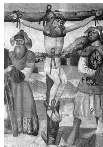
Püha Olavi ristisurm. (Andenesi kirik, Norra, ca 1500.)