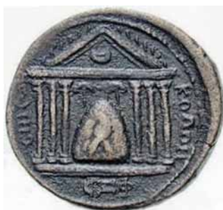
Päikesejumal Elagabali võrdkuju tema auks püstitatud templis.