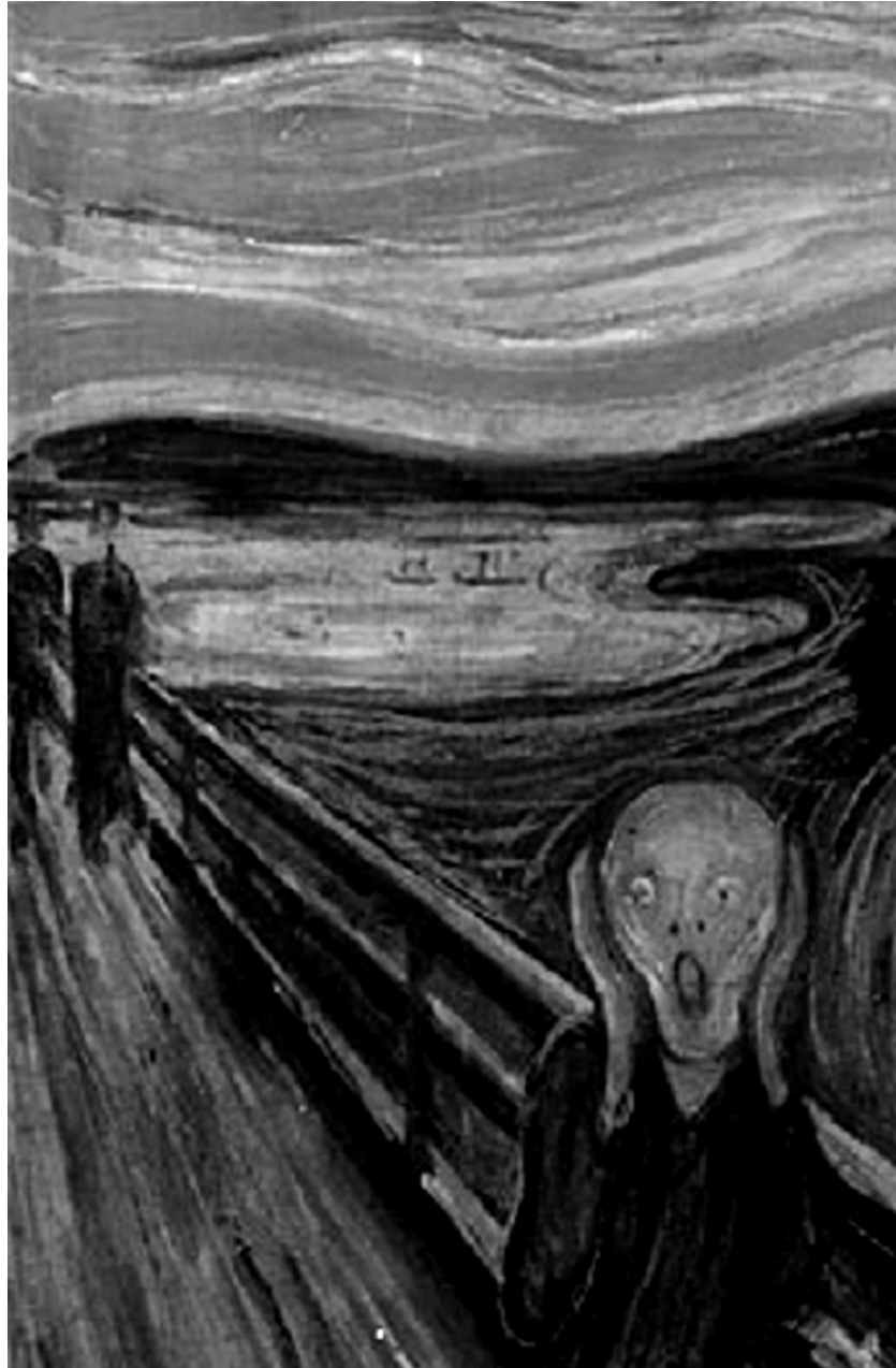
Kohati meenutab "Hingede öö" Edvard Munchi "Karjet", kus inimene seisab silmitsi puhta eksistentsiga, mis kohutab.

Millised on Surnud mehe maja ruumielemendid ja nende iseärasused? Mis tõendab kujutlust majast kui suletud ruumist? Milliseid aja- ja ruumisuhete teisenemisi või moonandumisi minategelane tajub? Mil viisil maja sisearhitektuur peegeldab inimälu toimimist? Millisena kujutab autor inimälu vahendatut