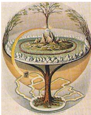
Muinaspõhja maailmapuu Yggdrasil.