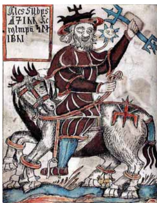
Peajumal Odin, üks ilm ohverdatud Miimiri kaevu.