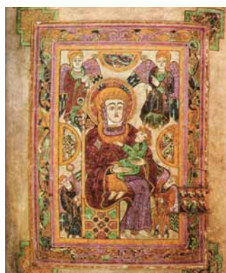
Book of Kells. Madonna lapsukesega, ca 800.