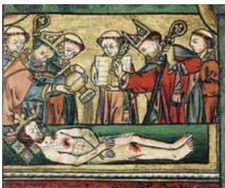
Püha Olavi põlvehaav, 14. saj.