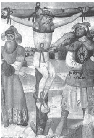
Püha Olav Kristuse koha peal. Norra, ca 1500.