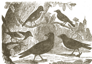
1. Raitsooll; 2. kaarna; 3. wares; 4. karatob; 5. pönnäär.